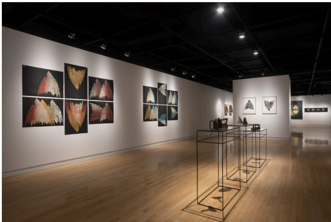
© Alejandra Basañes, 2024. Photo: Étienne Boisvert.