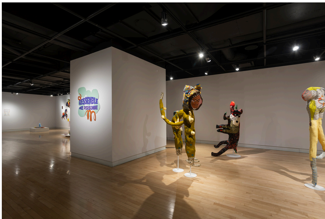
© Ressemble à personne, 2023. Photo: Étienne Boisvert.