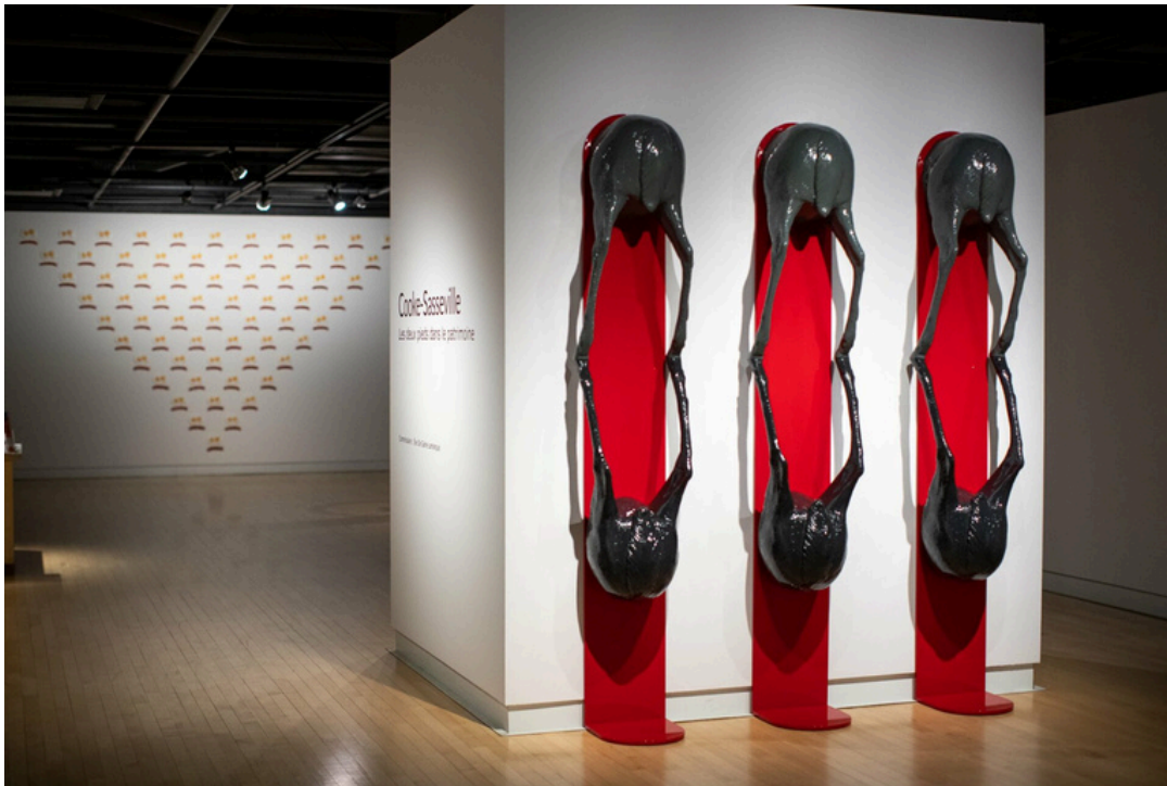
© Cooke-Sasseville, 2022.