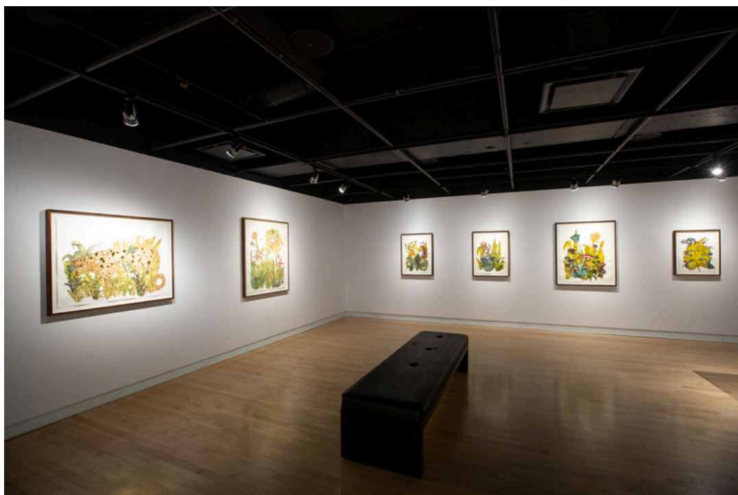
© Isabelle Demers, 2022. Crédits photos: Olivier Croteau