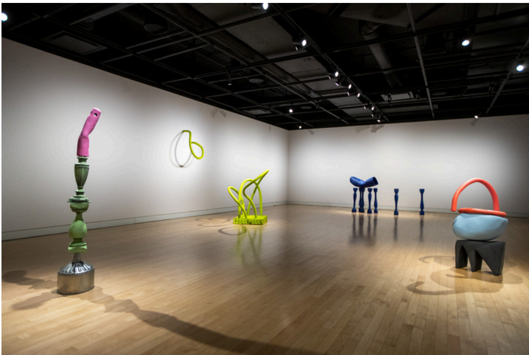
© Marie-Ève Fréchette, 2022. Photo : Olivier Croteau