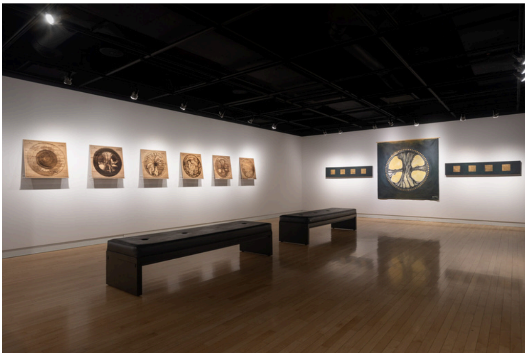
© Alejandra Basaños, 2024.