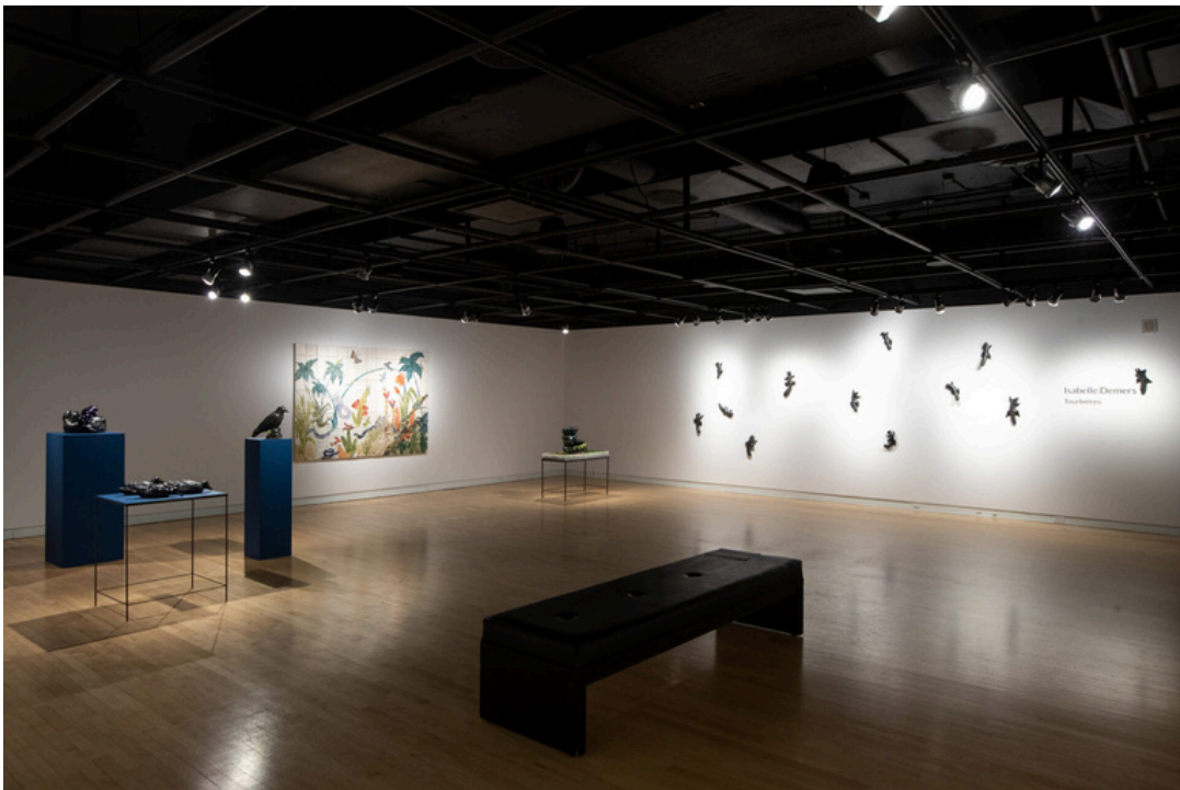
© Isabelle Demers, 2022. Crédits photos: Olivier Croteau