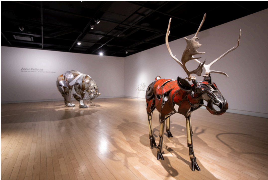
© Annie Pelletier, 2023. Crédit photo : Olivier Croteau.